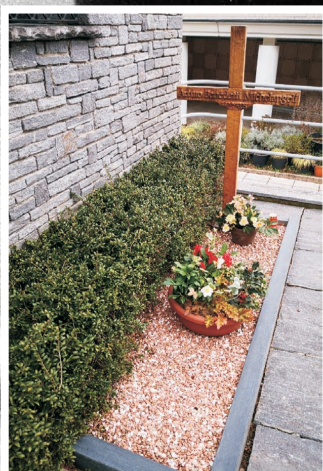
...essere sepolto nella nuda terra con una sola croce... A Pura! (ultime volontà di ABM).

...Ma è anche vero che i greci, quando ragionarono intorno all'essere sotto l'Acropoli, si accorsero che se il tempo è destinato a ritornare, allora tutte le vite che viviamo o che vivremo le abbiamo eternamente vissute; e tutto ciò che facciamo o faremo lo abbiamo eternamente fatto. Se è così un pianista rifugiatosi a Pura suonerà eternamente per noi. (Armando Torno)