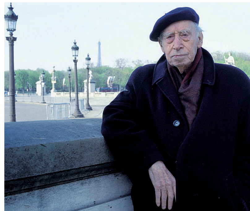
Il poeta Mario Luzi (1914-2005) ritratto a Parigi nel 2002

la poesia. Alla prima l'uomo deve la propria esistenza, alla seconda la propria identità. La particolarità della poesia è quella di nascere dall'utero del linguaggio-vita così come l'infanzia viene dall'utero della donna-femminilità.